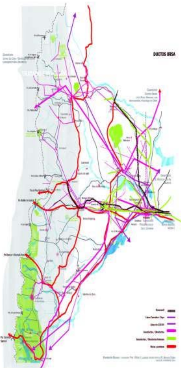
Mapa ductos del Eje del Sur en Neuquén.

todos estos mega emprendimientos mineros y energéticos no responden, por una cuestión de escalas, a las necesidades locales y/o regionales, sino que responden a las necesidades de un mercado que está demandando determinados productos de manera intensiva. Tampoco podemos pensar en la producción de determinados minerales sea para bastecer el mercado interno, como en el caso Potasio Río Colorado, en Mendoza, cuando requiera potasio como fertilizante. Está dicho en los decretos presidenciales que es exclusivamente para la exportación: 2,4 millones de toneladas de potasio al año, de las cuales el 95% se destina al mercado externo, en este caso, Brasil. Con el cobre pasa exactamente lo mismo, no es para abastecer el desarrollo tecnológico interno, sino que se exporta cuasi en bruto.